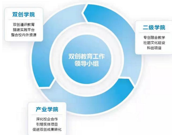
图2 双创教育“三元合力、专创融合、协同育人”机制