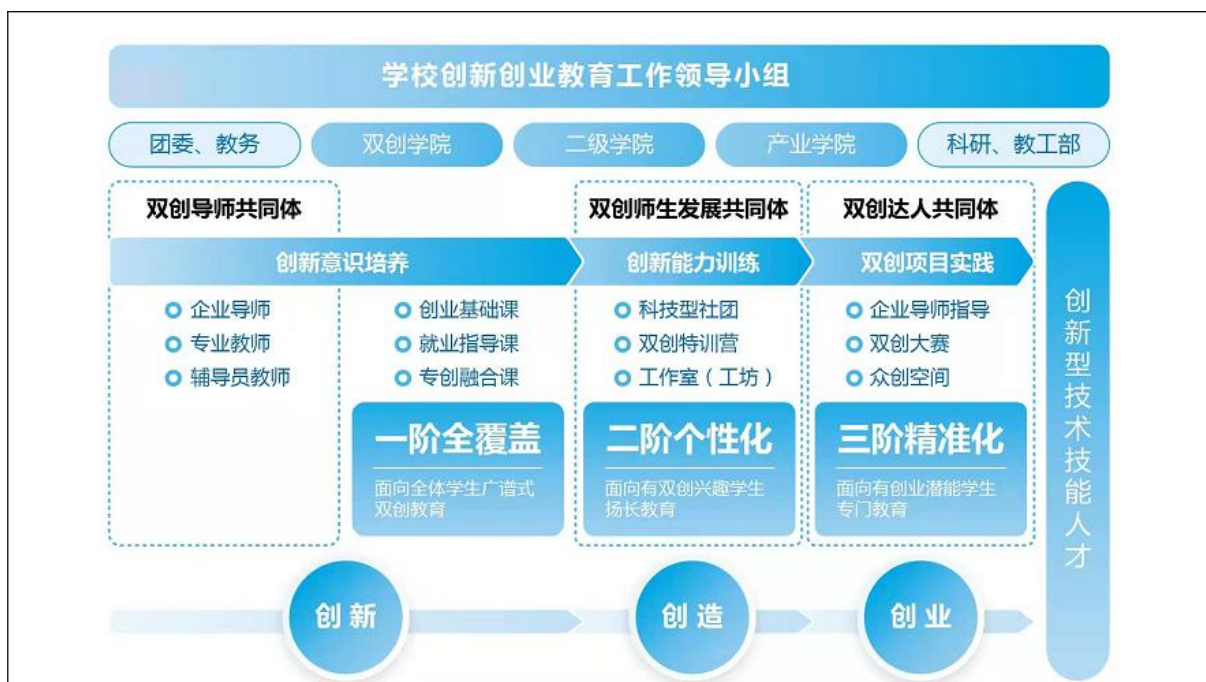
图1 天职双创教育“四三”模式