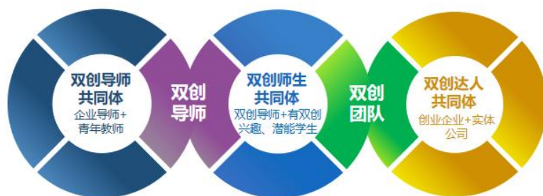
图3 “双创三共同体”螺旋递进模式

双创导师共同体 ：引入企业导师，建立企业导师与校内教师“师徒结对”和校企、校际联合培养机制，专业教师到企业挂职锻炼，建立双创导师教学能力和项目指导能力评价体系，促进专业教师转型为双创导师。 双创师生发展共同体 ：双创导师与有双创兴趣学生以创新工作室或校企专创工坊为载体共训、共研、共创；与有双创潜能学生以双创大赛或创新创业项目为载体共同进行双创项目实战，制定项目团队考核标准，促进双创导师与项目团队学生教学相长、共同发展。 双创达人共同体 ：双创导师与有双创实践的学生以科研成果或双创成果为依托，共同组建实体公司和创业团队，创新工艺、产品和商业模式，以成功创业实践反哺双创教育的双创导师与双创实践学生组成的双创达人共同体。三个共同体有交互、有独立，形成了螺旋递进的模式，共同发力、提升师生双创素养和能力。